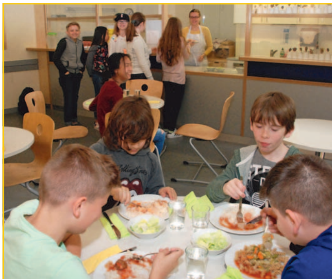
Gemeinsam Essen, Lernen und Spielen: die Nachmittagsbetreuung des Kant-Gymnasiums wird ab dem neuen Schuljahr flexibler gestaltet.